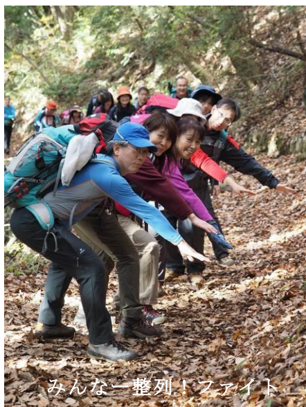
みんな一列！ファイト