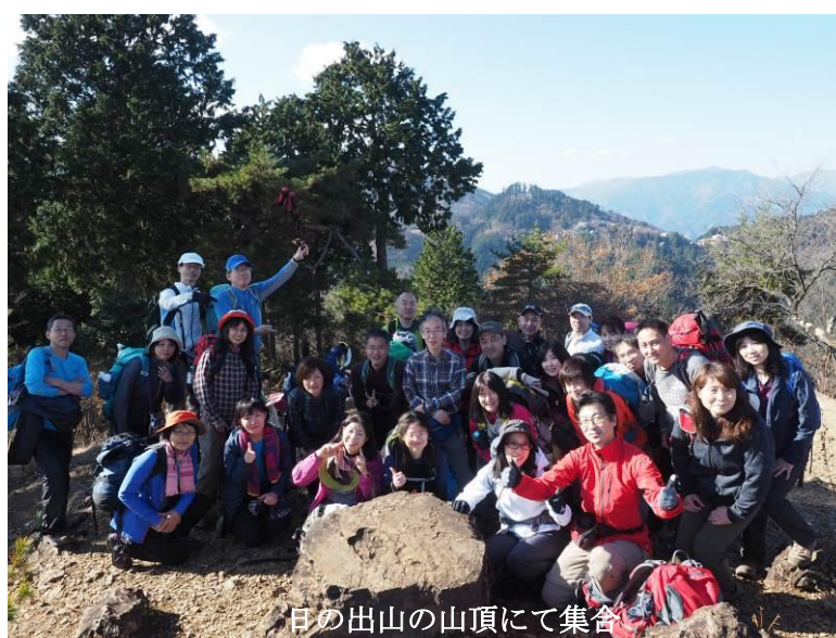
日の出山の山頂にて集合