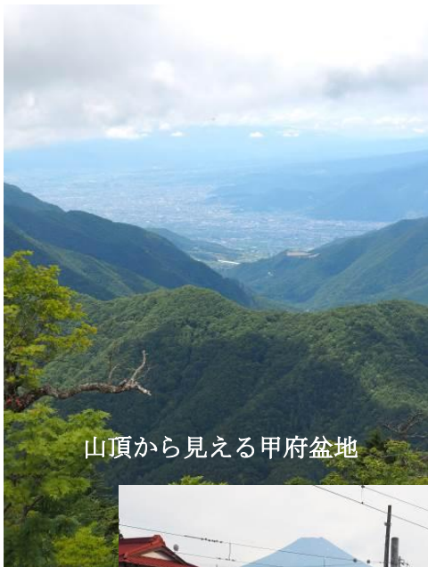
山頂から見える甲府盆地