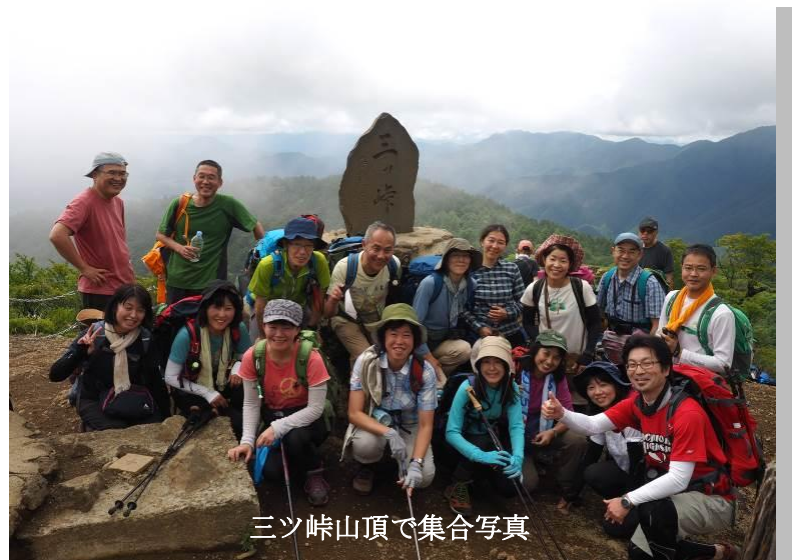
三ツ峠山頂で集合写真