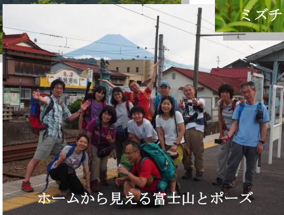
ホームから見える富士山とポーズ