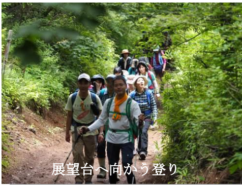
展望台へ向かう登り