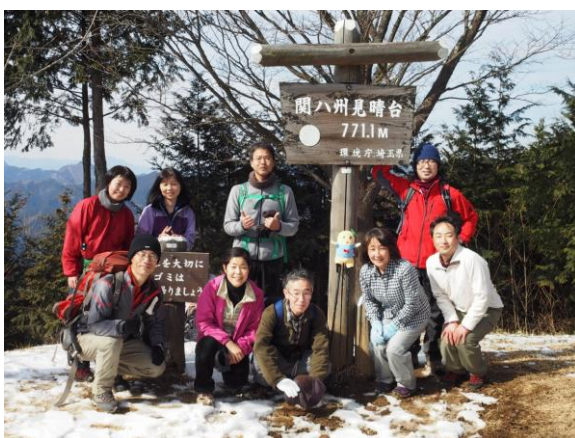
山頂もいとお天気でした