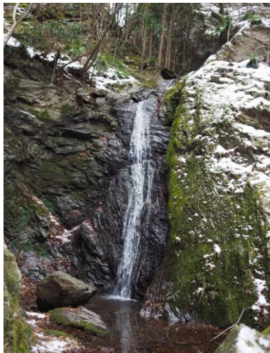
滝に癒されました