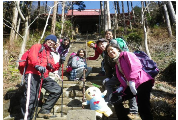
高山不動尊で受験生の合格祈願