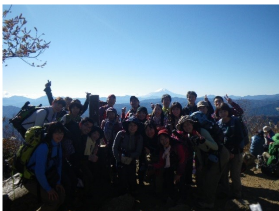
文句のないお天気の中 ハイポーズ