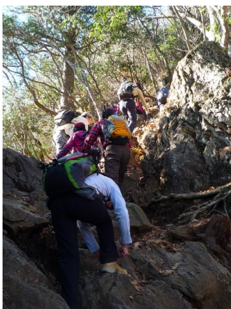
もう少しで頂上だ一頑張り