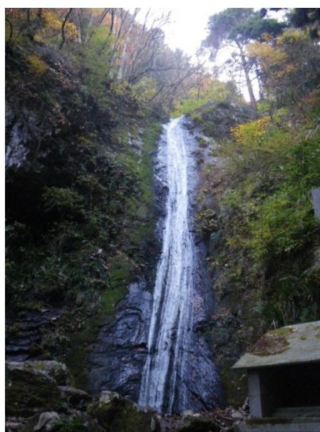
綾滝 疲れた体が癒されます