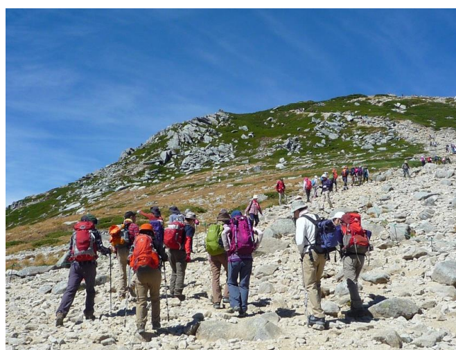
木曽駒ヶ岳山頂を目指します