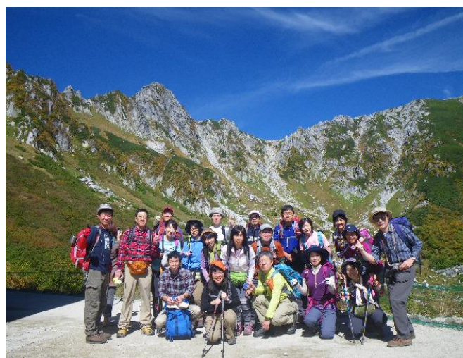
千畳敷カールをバックに記念写真