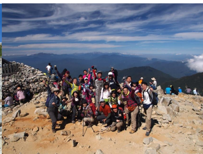
木曽駒ヶ岳山頂でガッツポーズ！