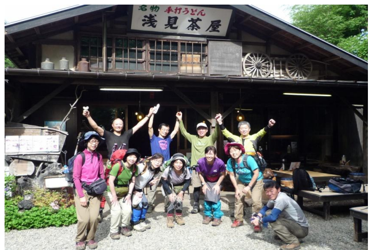
美味を満喫して、笑顔いっぱい