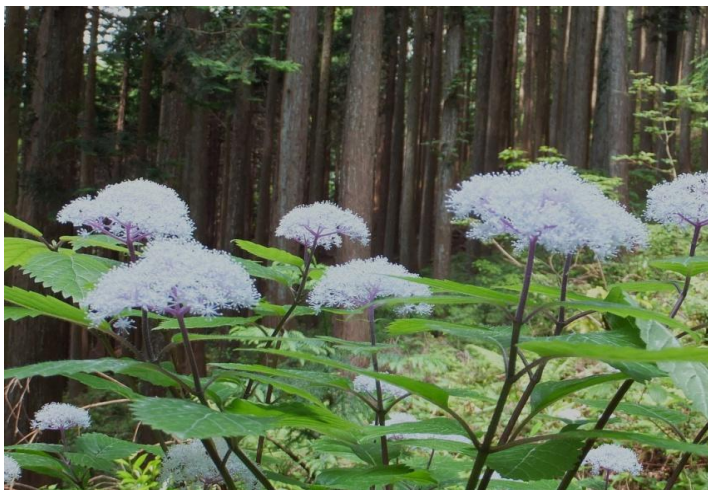
この季節の山はコアジサイ