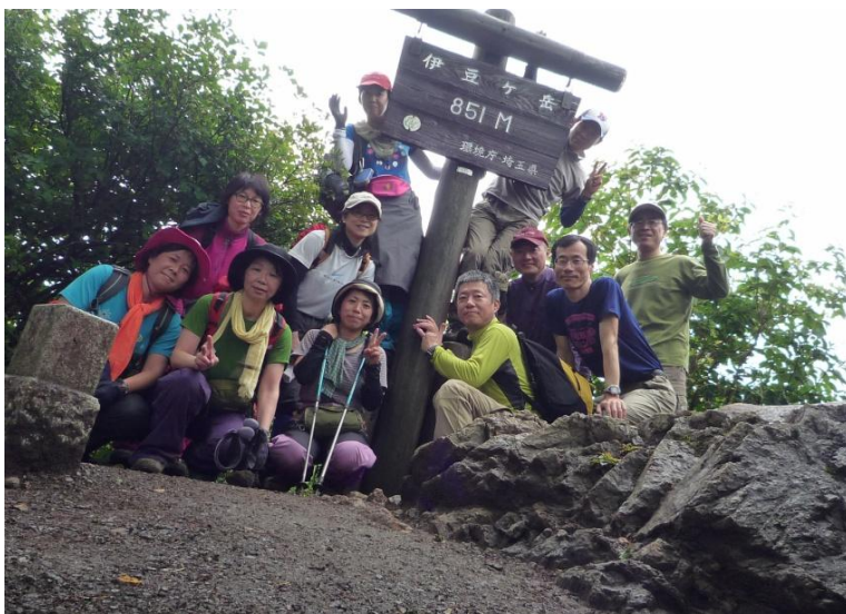
傾いているのはカメラの方です(・_・;)