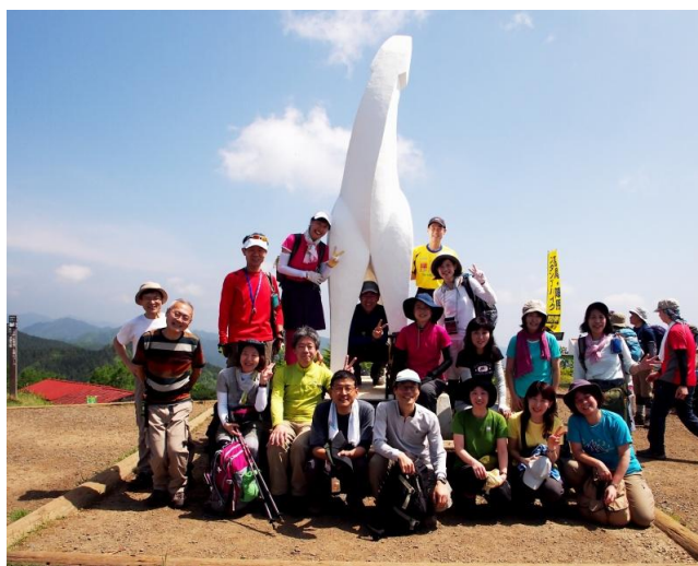
陣馬山山頂で笑顔いっぱい