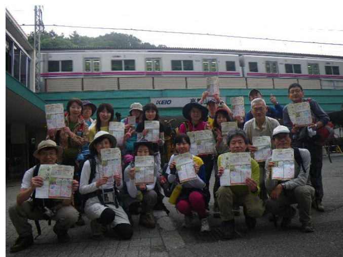
スタンプハイク、ゲットです！