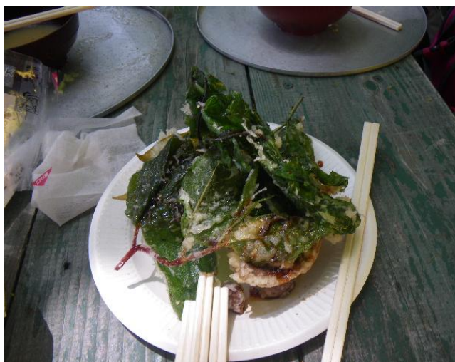
景信山頂での天ぷら