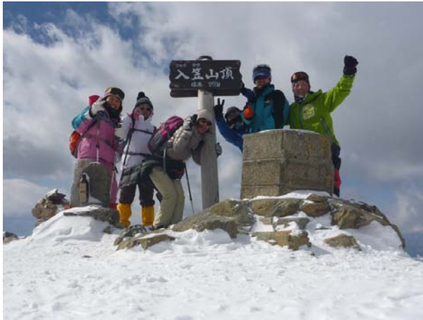
山頂で笑顔いっぱい！