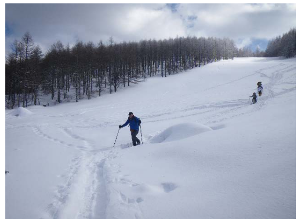
新雪の中を歩きます