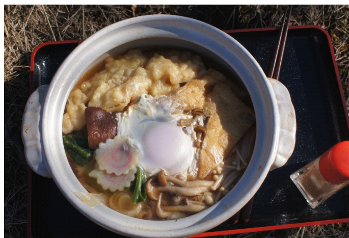
鍋割山荘名物の鍋焼きうどん