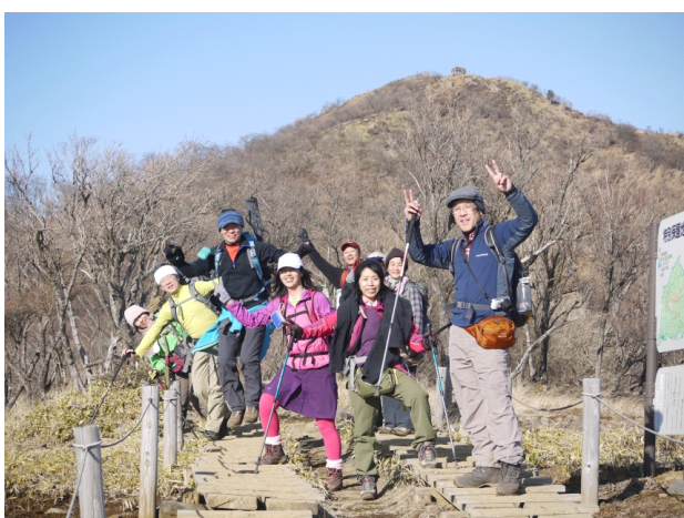
笑顔の絶えない楽しい一日でした