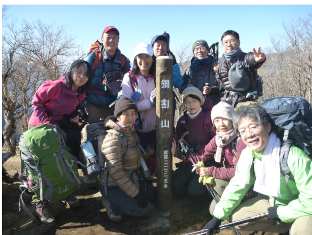
2013年最初のピークハントです