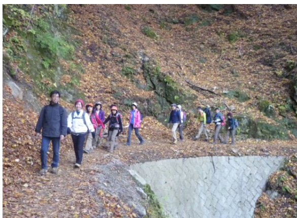
下りは旧トロッコ道。緩やかな歩きやすい道です。