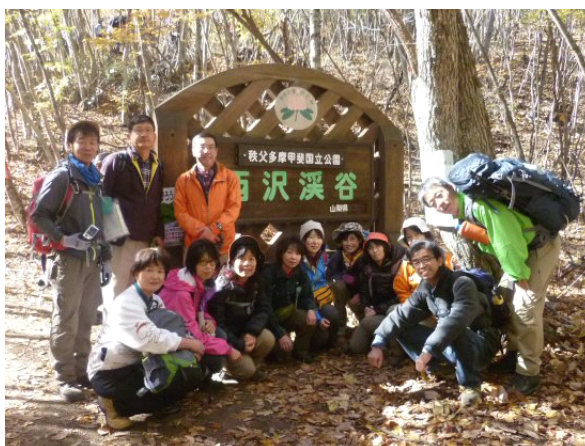
記念撮影。天気は快晴。みんなの顔も笑顔です。