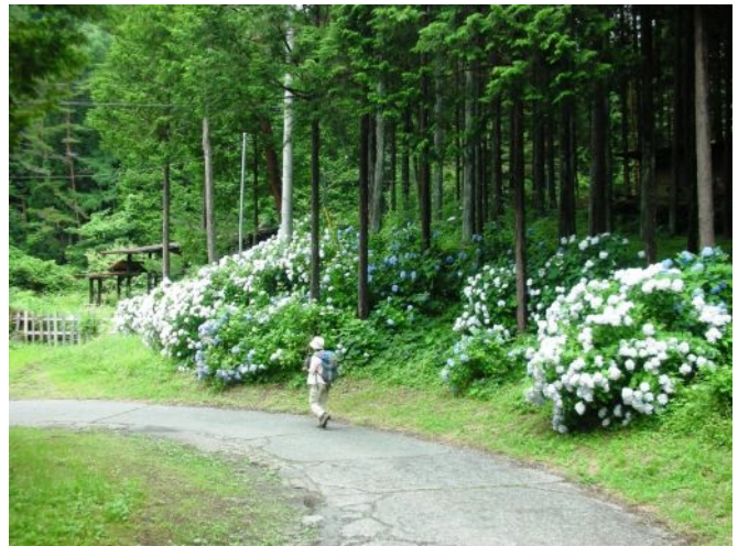
紫陽花もまだまだきれいに咲いています