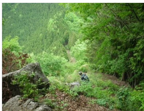
鋸尾根を降ってます